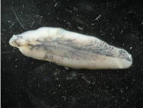
Májmétely ( Fasciola hepatica )